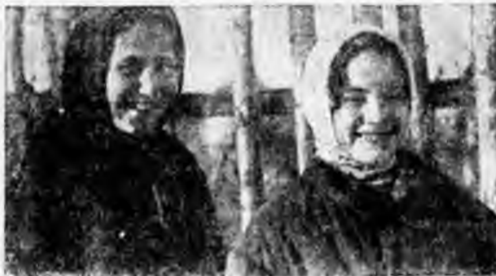
«БУДЕМ ПОМОЩЬ ОКОЛНАМИ!»