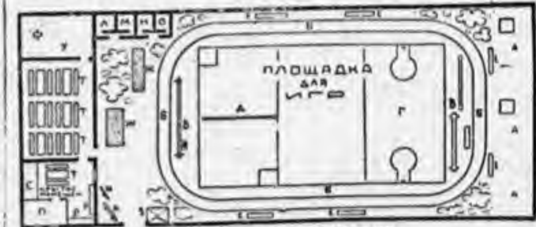
ПЛАН ЛЕТНЕЙ ПЛОЩАДКИ.

уборные (для мальчиков и девочек) и душ. Душ очень важен, так как тело во время занятий потеет и грязнится (в крайнем случае, душ можно сделать из простой лейки). Желательно иметь небольшой ручья для поливки площадки в жаркую погоду, и обязательно кипяченая питьевая вода и закрытых банок. Когда площадка огорожена, нужно прибрать ее, удалить мусор и разровнять. Эту работу лучше сделать всем ребятам вместе, в виде субботника. Затем, при помощи веревок и колышков, нужно разметить площадку. На нашем рисунке дан план образцо-