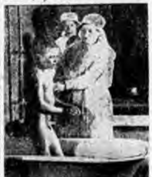
Беспорядочный в изоляторе.

1-й и 2-й отряды Ю. П. при Бурынском государственном сахарном заводе вносят 6 р. 50 к. и вызывают школы 1-й и 2-й ступени при заводе.