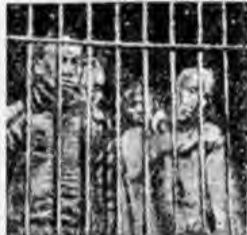
В ЗАСТЕНКАХ У ЧЖАН-ЦЗО-ЛИНА.

Видали вы, ребята, как иногда несколько собак дерутся из-за кости. Такими