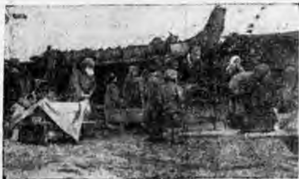
СОТИРОВКА А СЕМЯН.