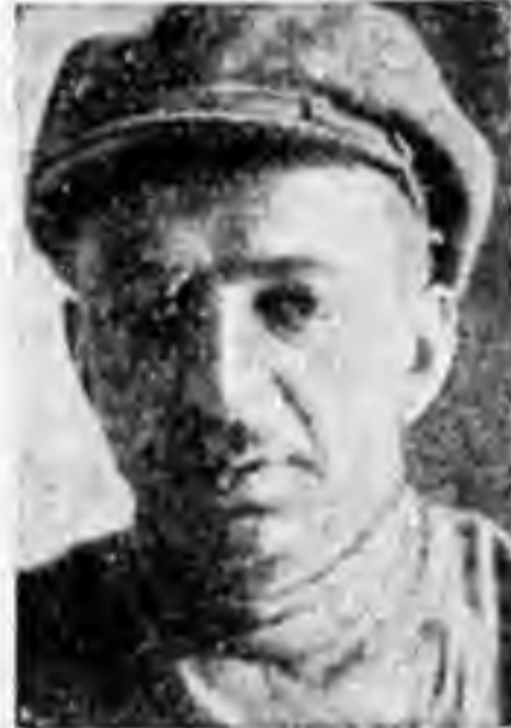
Тов. Юмиландес предводителем.

Основные сведения о количестве членов Союза сле-