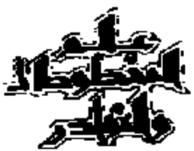
صورة الصفحة الأخيرة من مخطوطة القاهرة

قرأت جميع هذا الكتاب معارضا بالاصل على مؤلفه الشيخ الامام العلامة فريد نعم ووجدته لسان العرب حجة أهل الادب فخر المحدثين والحفاظ فارس المعاني والالفاظ رضى الدين ابى الفينان الملاسن بن محمد بن الحسن القرشي العدوي تصانيفه في اللغة قدس ونشر ذكره في مستهل جمادى الآخرة سنة خمسين وستة بالموسم الطاهري من بغداد وكتب عبد المؤمن بن خلف بن ابى الحسن الهمداني طبع ذلك وكتب الملقب الى سرور الله تعالى الحسن بن محمد بن الحسن الصفار اعلاه الله الى جرمه بفضل رحمة في التاريخ حامدا ومصليا م