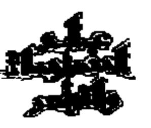
صفحة الغلاف وفيها العنوان

الكتاب الذي هو الكتاب الذي هو الكتاب الذي هو